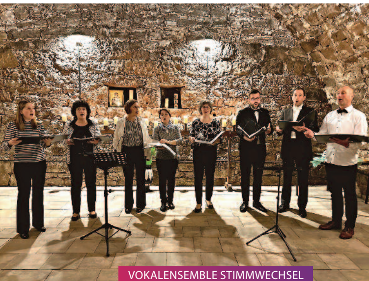
VOKALENSEMBLE STIMMWECHSEL Konzert am Nachmittag // 24.08.