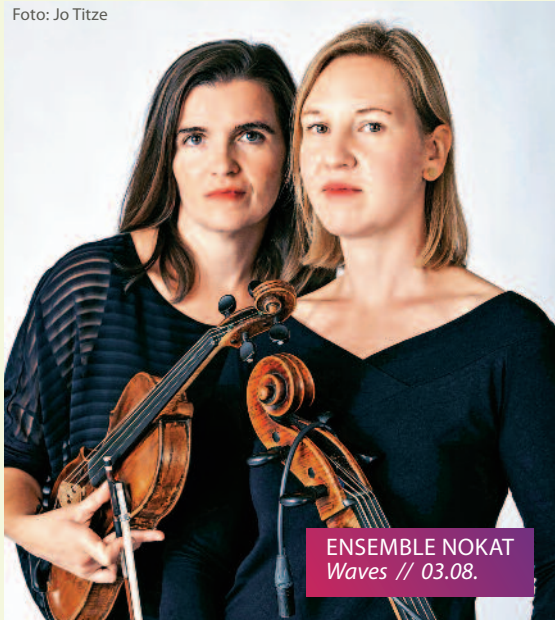
ENSEMBLE NOKAT Waves // 03.08.