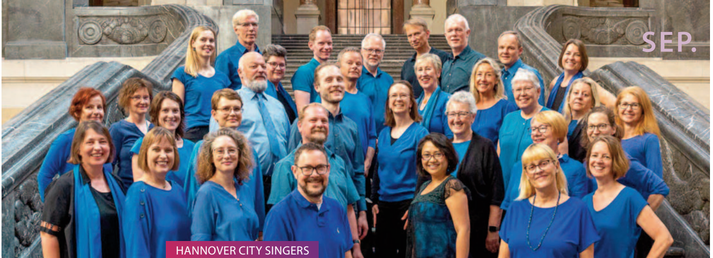
HANNOVER CITY SINGERS Chorkonzert // 07.09.