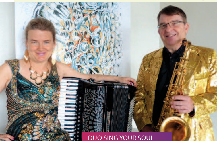
DUO SING YOUR SOUL All you need is love! // 13.10.