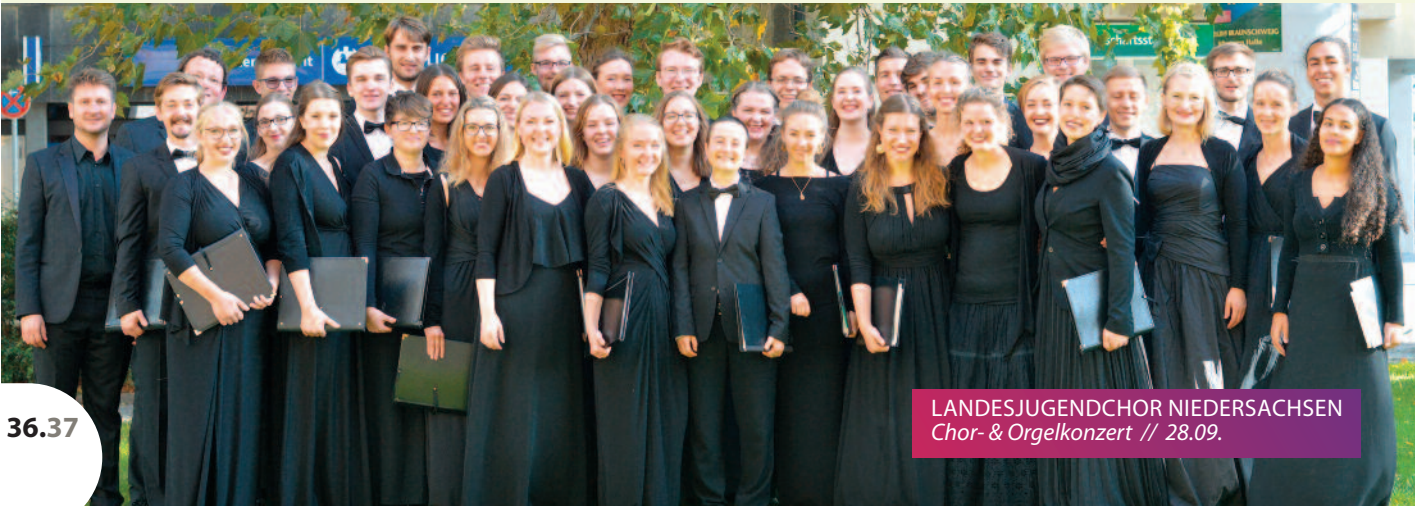
LANDESJUGENDCHOR NIEDERSACHSEN Chor- & Orgelkonzert // 28.09.