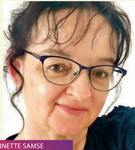
ANNETTE SAMSE Wir feiern ein Fest // 28.09.

Werke von Stenhammar, Wikander, Schönberg, Orff, Britten u.a. Mikaeli Chamber Choir, Ltg. Anders Eby Veranstaltung im Rahmen der chor.com Eintritt: € 28,- | erm. 18,-; VVK: reservix.de