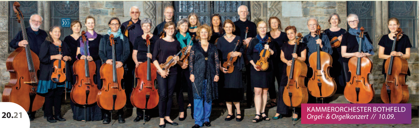
KAMMERORCHESTER BOTHFELD Orgel- & Orgelkonzert // 10.09.