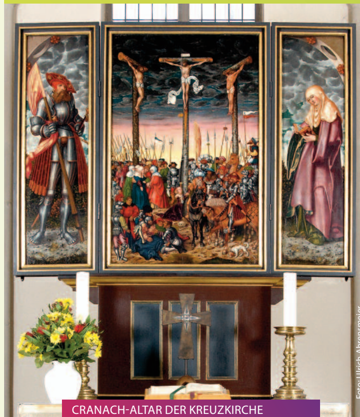
CRANACH-ALTAR DER KREUZKIRCHE Andacht 5pm – Die Pause am Mittwoch // 02.10.