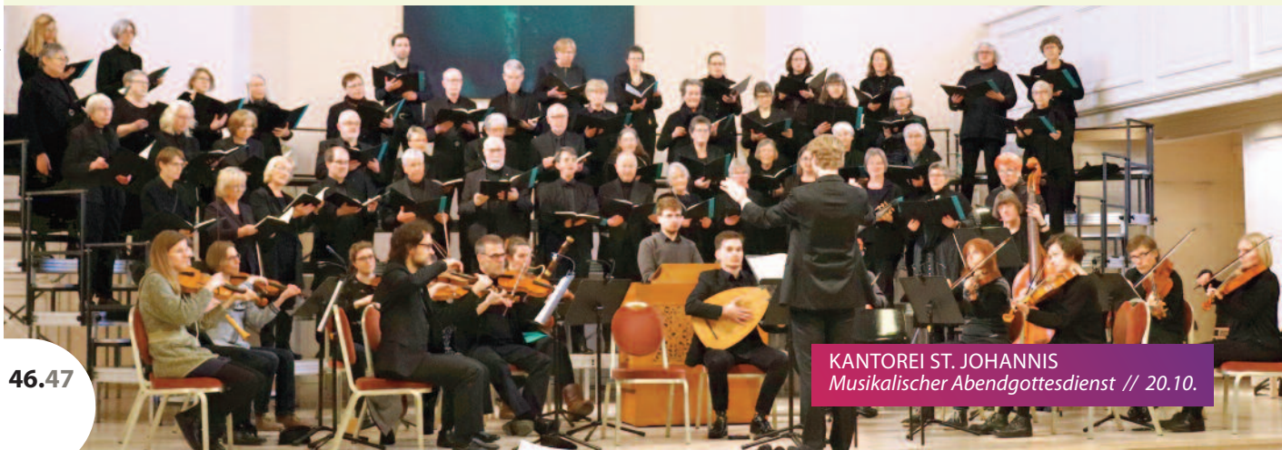
KANTOREI ST. JOHANNIS Musikalischer Abendgottesdienst // 20.10.