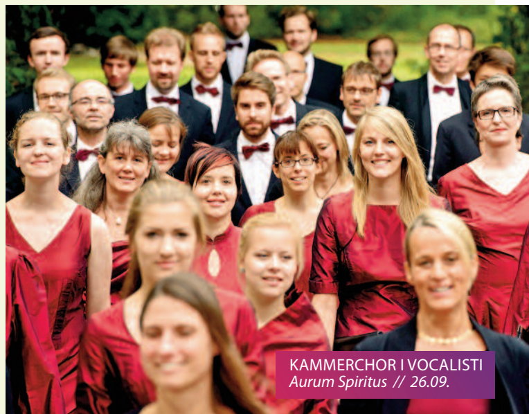
KAMMERCHOR | VOCALISTI Aurum Spiritus // 26.09.