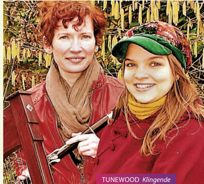
TUNEWOOD Klingende Inspiration // 12.09.