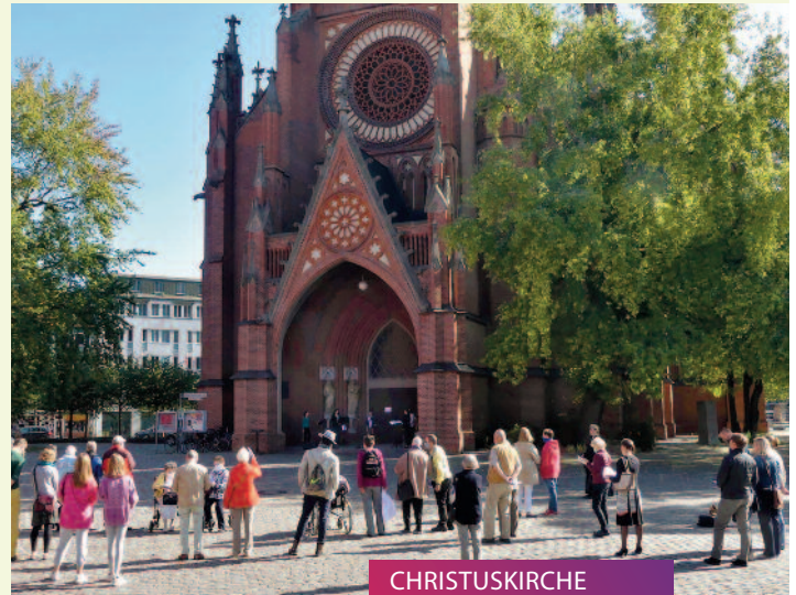
CHRISTUSKIRCHE Kirchenführung // 03.08.