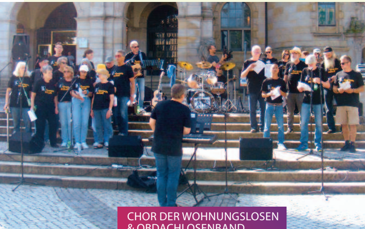
CHOR DER WOHNUNGSLOSEN & OBDACHLOSEN BAND Ein Zuhause // 15.09.