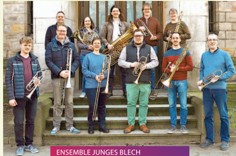
ENSEMBLE JUNGES BLECH Ev. Messe auf dem Gartenfriedhof // 11.08.